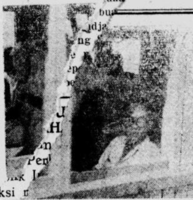
Mr. Amir Sjarifuddin, bekas perdana menteri, kini sebagai orang tangkapan, didjaga oleh pengawal bersenjata, duduk di dalam kereta api dalam perdjalananan untuk ditawan terus di Jogja.

Djuga pihak Inggeris tersebut menjatakan bahwa sekretariat Dewan Keamanan telah mulai pindah ke New York, sehingga hampir tidak tjukup pegawai2 lagi guna dapat menjelenggarakan persidangan tersebut.